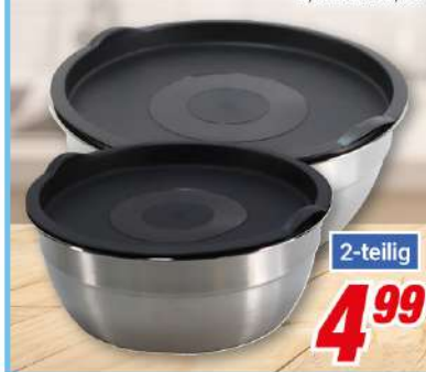
Schüssel-Set 2-teilig aus Edelstahl, mit Deckel, 1,8 l und 3,2 l