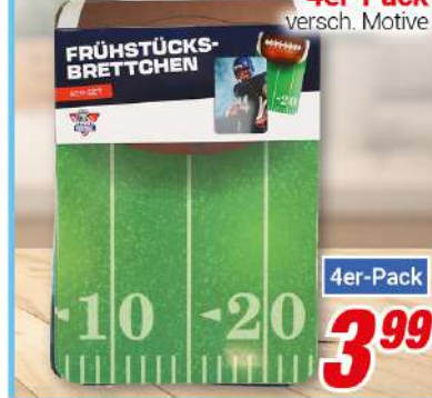
Frühstücksbrettchen 4er-Pack versch. Motive