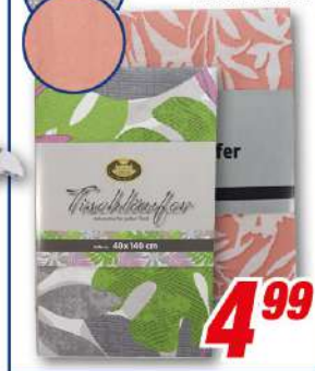
Tischläufer versch. Farben, 40 x 140 cm