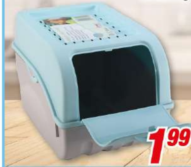
Gemüsebox 29 x 20 x 19 cm, für ca. 5 kg