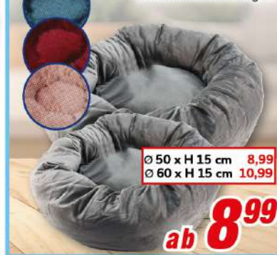
Haustierbett versch. Ausführungen

Ø 50 x H 15 cm 8,99 Ø 60 x H 15 cm 10,99