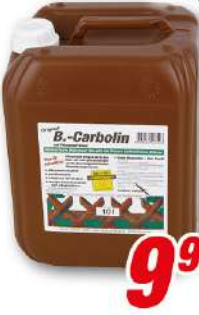
B.-Carbolin 10 l auf Pflanzenölbasis, Farbton: Holzbraun, Holzlasur 1 l = 1,00