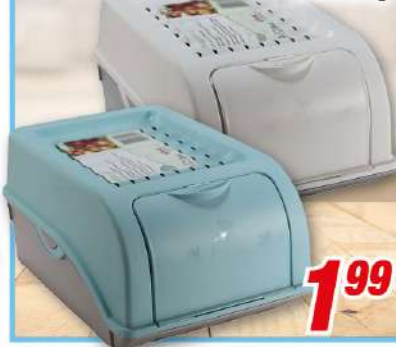
Zwiebelbox 29 x 20 x 14 cm, für ca. 3 kg