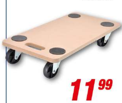
Transportroller Tragkraft: bis 150 kg, 58 x 29 cm