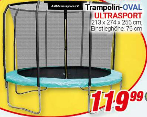
Trampolin-OVAL ULTRASPORT 213 x 274 x 256 cm, Einstieghöhe: 76 cm