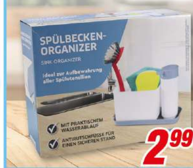
Spülbecken-Organizer 24 x 18 x 10 cm, versch. Farben