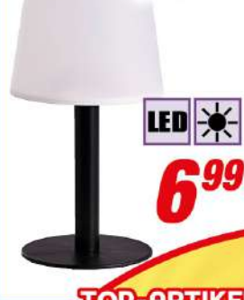
LED-Solar-Tischlampe Ø 15 x 31 cm