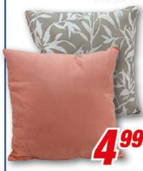
Dekokissen versch. Ausführungen, 40 x 40 cm