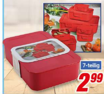
Frischhaltebox-Set 7-teilig versch. Größen