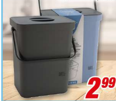
Bio-Abfalleimer 25 x 19 x 15 cm, versch. Farben, für 5 l