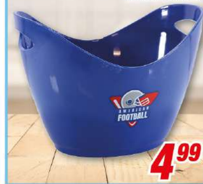
Flaschenkühler 27 x 21 x 18 cm